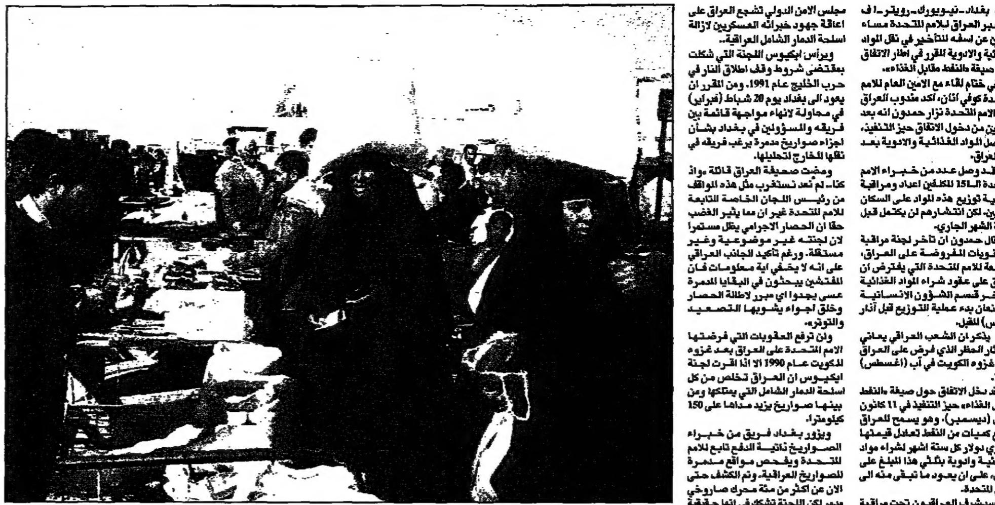
سيدات عراقيات يتسوقن في بغداد